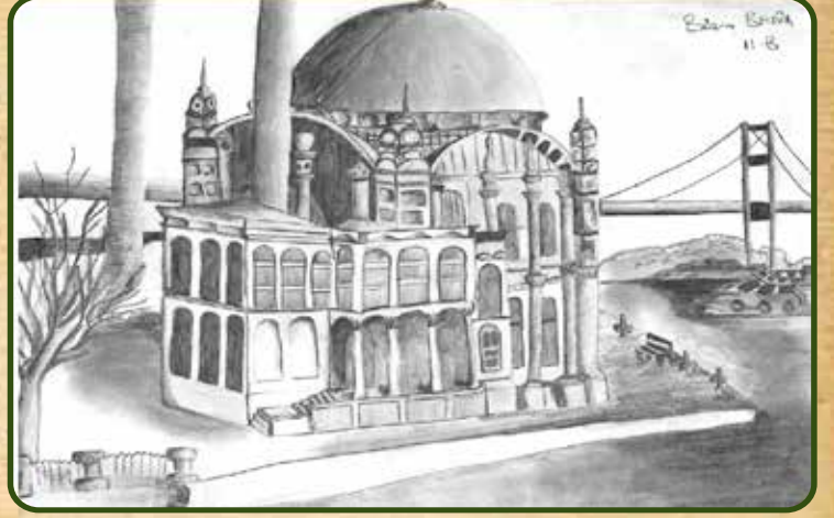
Büşra Bedir 11B